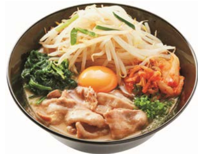
徳島ラーメンに、もやし+ほうれん草+キムチをトッピングした例